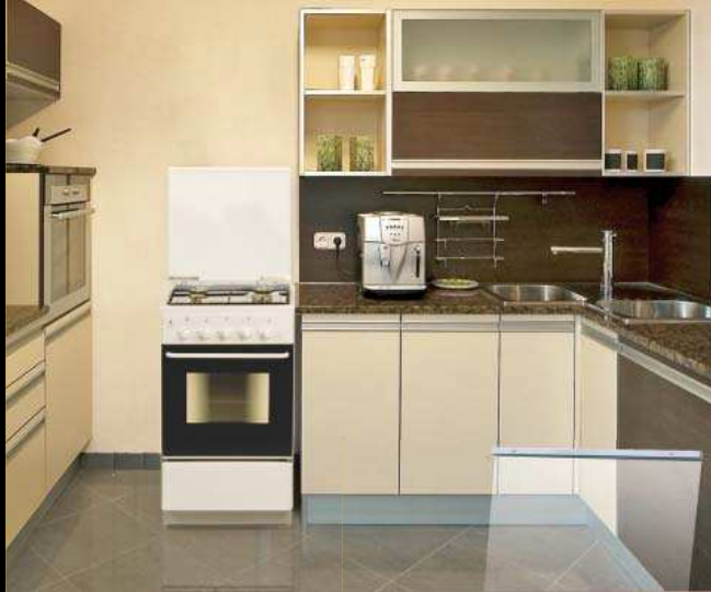
T5 LUX tűzhely